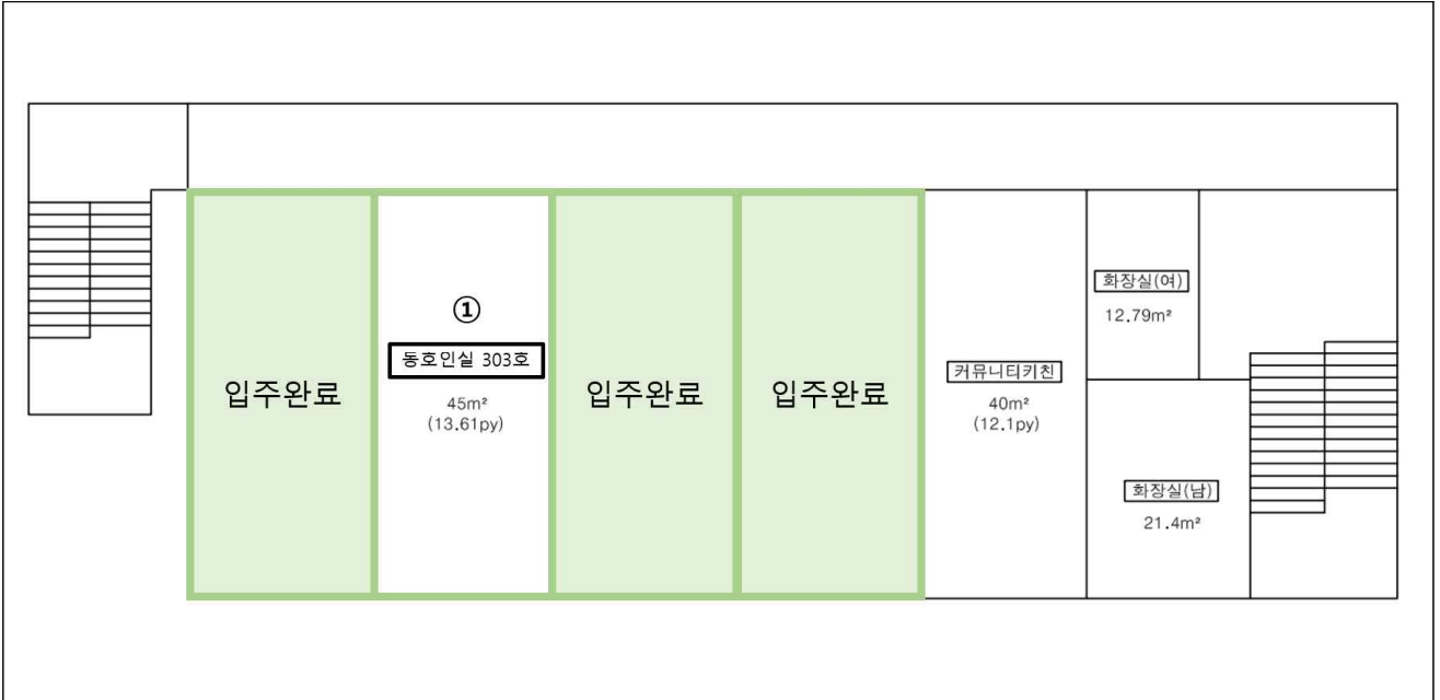
로컬 크리에이터 단체 입주공간 (창작동 3층) / 1실